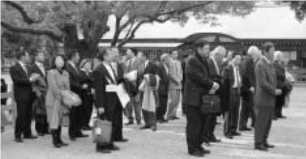
垣内参拝の前に集まったライオンズメンバー

恒例の新年例会が今年も熱田神宮会館で行われました。今年に入って寒い日が続きましたが、今日は朝から雪が舞って、寒さも一段と身にしむ日となりました。今年は特に昨年からのリーマンショックに始まって、地元トヨタ自動車の不振ぶりは驚きの展開でしたが、中部地区の三河、尾張の影響はこのほか厳しいものでした。マスコミでは大恐慌の再来とか言っていますが、その大恐慌が終結したのは戦争という途方もない浪費だったそうです。歴史が繰り返さなければ良いのですが、少々不安でもありますね。毎年この新年例会は、熱田神宮の垣内参拝ができることもあって、初詣も兼ねて出席率が良いようです。私も毎年新年例会には熱田神宮の破魔矢を買って帰るのが恒例になってしまいました。今年の干支は「丑」。牛は肉が大切な食料に、力は労働にと社会に密接にかかわる干支だそうで、この干支の特徴は「粘り強さと誠実」だそうです。この心意気は100年に1度の金融不況に活路を見出すためにはピッタリではないでしょうか。