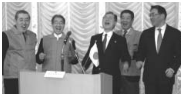
初笑いをする年男のライオンズの皆さん

さて、今年は昨年の米国サブプライムローン問題に端を発した経済危機が発生し、その影響は米国のみならず、中国をはじめとするアジアや欧州など世界に広がっており、わが国経済への影響は甚大であります。こんな時代だからこそ、人と人の心の交流を大切にし、ライオンズの皆様のご縁を重んじて「常日頃の心掛け」という言葉に感動しながら「笑顔で奉仕 奉仕で笑顔」の精神で今年1年を過ごしていきたいと思致します。