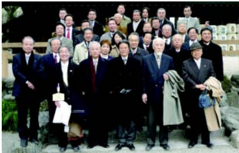
新年例会にて熱田神宮の垣内参拝を終えた ライオンズメンバー