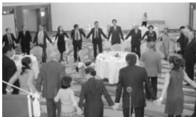
恒例の「また会う日まで」を皆さんで歌って今年最後の例会も終わりました